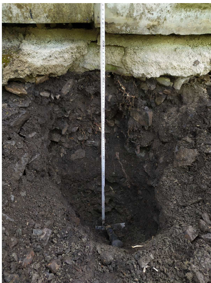
Sonda založení u KS01-2

AZ Consult, spol, s r.o., Příloha 6 - Fotodokumentace - úsek 2A