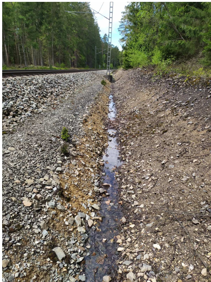
viditelná stuktura nedaleko ks05-5