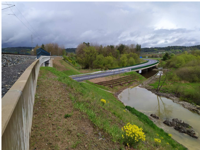
situace mostku přes mokřady