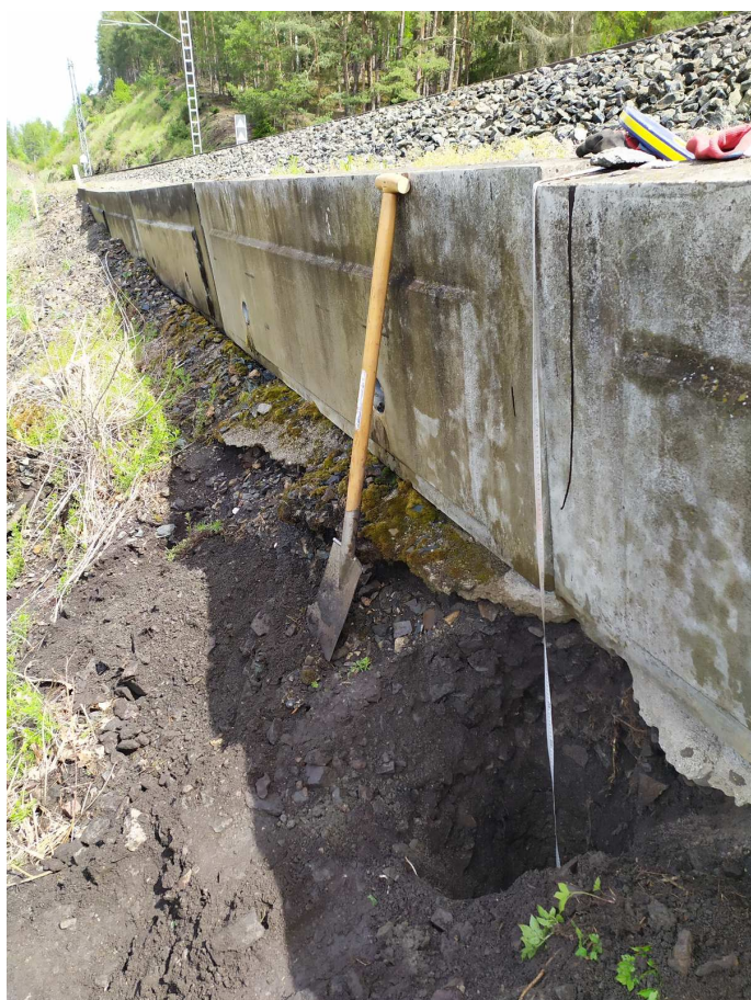
Sonda založení u KS01-2 (2)

AZ Consult, spol, s r.o., Příloha 6 - Fotodokumentace - úsek 2A